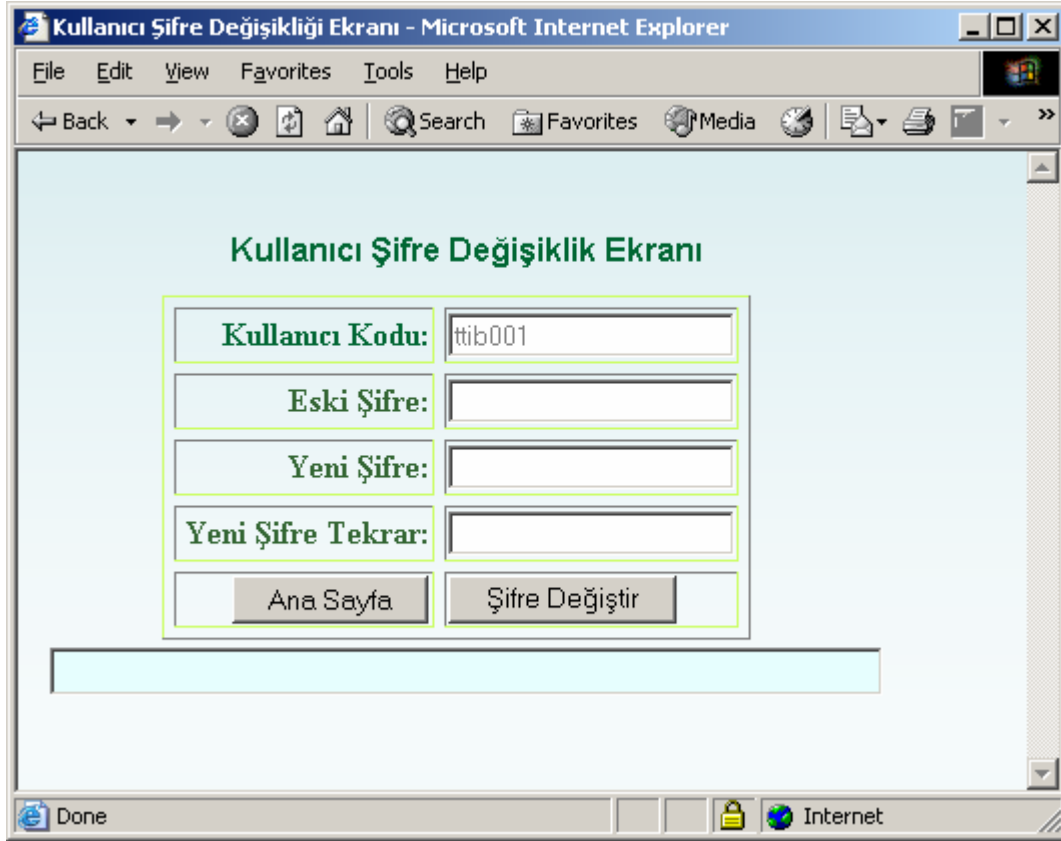
Şekil 3: Kullanıcı Şifre Değişikliği Ekranı

Şifreler kullanıcıya özel olduğundan, yetkililerin İMKB Tahvil ve Bono Piyasası'ndan temin ettikleri şifrelerini değiştirmeleri zorunludur. Ana menüden Kullanıcı Şifre Değişikliği seçeneği seçilerek şifre değişikliği ekranına girilir. Ekranın görünümü Şekil-3'de yer almaktadır.